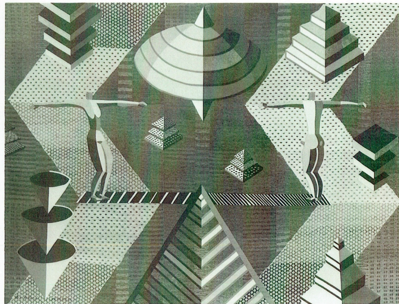
»I rättvisans namn« av Eva Rodenius, utförd av HV och placerad i Stockholms rådhus.