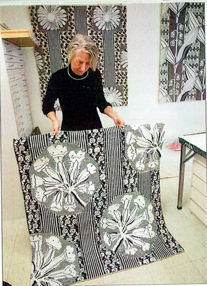
De första vävarna med skafststyrning vävdes i svart och vitt.

PÅ VÄGGARNA HÄNGER VÄVAR som ska visas på kommande utställningar. Rosor i starka färger tecknade mot mönsterrika bottnar, en liljekonvalj i grafiskt svart och vitt, några prästkragar med två olika mönstervävd bottnar. Associationerna går lätt till jugendmönstrade tapeter.