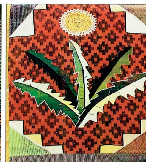
T v "Vi vill ut" 220 x 80, en av Eva Rodenius tidiga vävar i trasor. Mitten "Speldosan" 210 x 120 cm. T h "Maskrosor på daldräll".