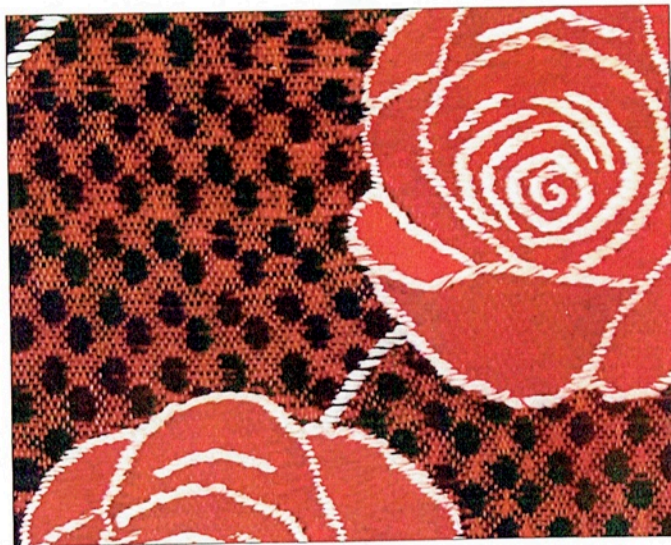
”Röd ros”, 53 x 50 cm.

– Nu, utan tvekan är det nu, och det jag står inför med alla tekniska utmaningar i mina nya vävar.